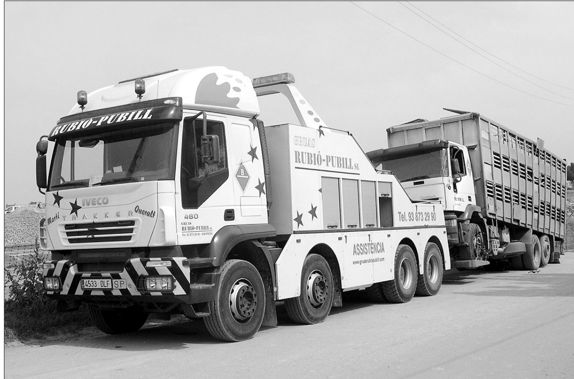
Un camió és remolcat per una de les grues de Rubió-Pubill

Per tant, no ens podem permetre el luxe de tenir grues aparcades esperant que hi hagi accidents quan sabem que aquests són per naturalesa imprevisibles».